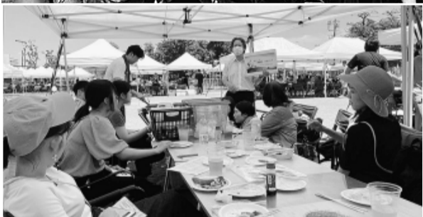
ミニ学習会 右上石澤中執

する姿は、とても新鮮に映りました。また、各テントのテーブルにQRコードを活用し、アンケートもお願いしました。特徴的な声を紹介しました。「今年の目標は」の問いに、ライフワークバランスを整える(よくする)や「生きる」、「生き残る」といった声がありました。 また、「今日の感想・次回やりたいこと」では、「同世代との交流」や「賃金を上げる」など、青年の率直な思いが伝わるものでした。実行委員会では、秋に向けて、楽しい企画を計画します。青年同士のつながり、交流を深める機会として、青年組合員の参加をお待ちしています。