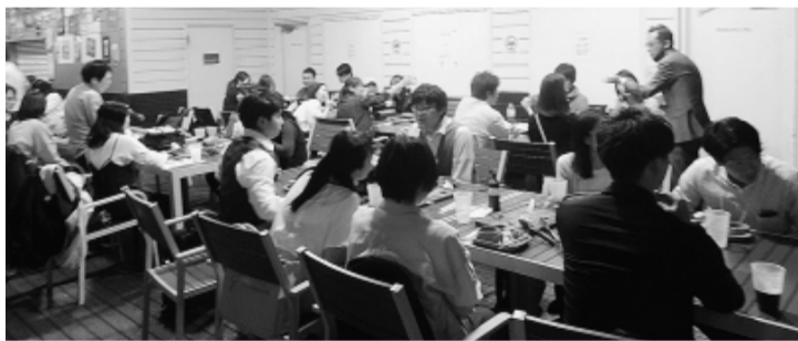
ビアガーデンで交流

目黒区職労は、4月17日〜25日まで目黒区職労知って得する講座「前編」を開催しました。 内容は、給料明細書の見方と労働条件の基礎知識で少人数で繰り返し開催しました。 今後は、後編を開催予定で、母体保護などの権利の他、人事異動についてのルールなど働き続けるための「お得」な講座です。美味しい軽食付きで、好評です。